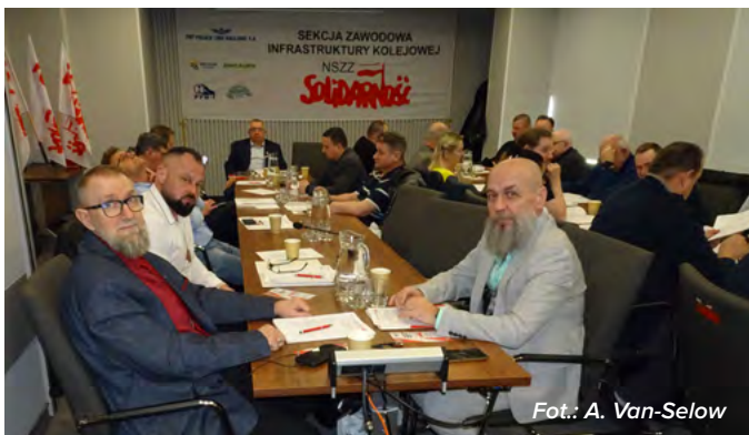
Delegaci z uwagą wysłuchali sprawozdań.

Na pytania delegatów – jak pracodawca zamierza zniwelować różnice