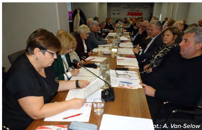
Członkowie prezydium mówili o swoim zaangażowaniu w pracę SZIK.