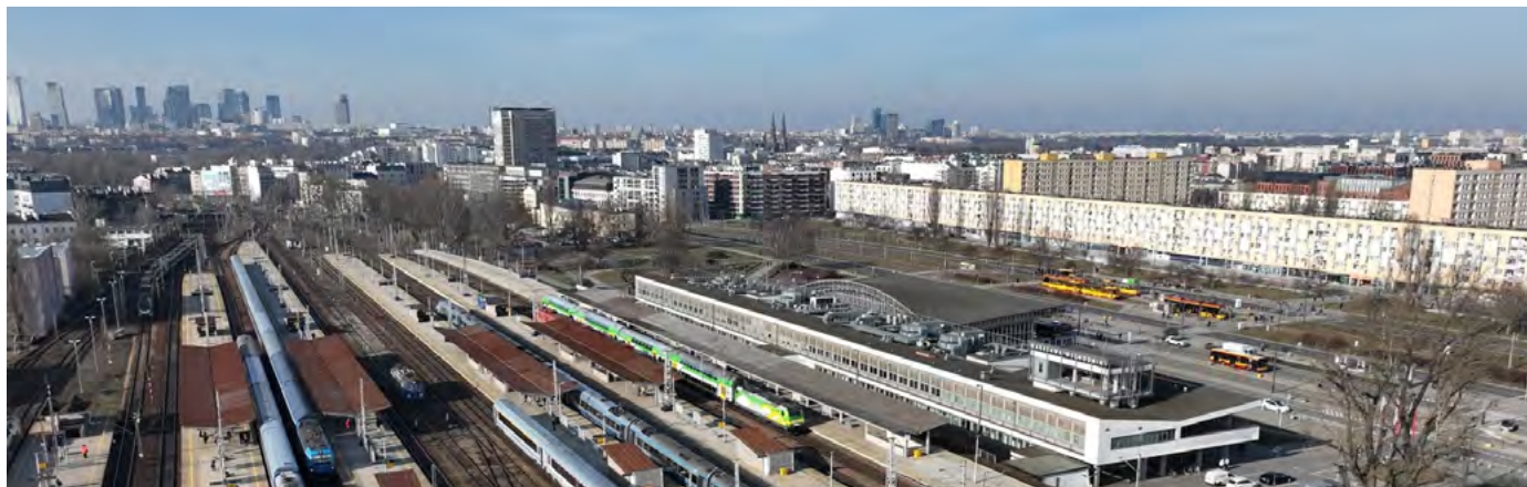
Widok z góry na stację Warszawa Wschodnia